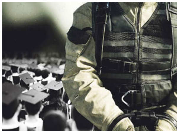
Коллаж Андрея Седых

Самое страшное, что это у них получается и в самых существенных аспектах военной организации России – аналитике, информационной сфере, воспитании, профессиональном образовании, идеологии и этике взаимоотношений в армии.