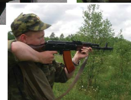
Тяжело в учении...

лала основной упор на подготовку детей войны — мамелюков (оторванных от родных корней детей покоренных народов), как касту слепо преданных султану воинов.