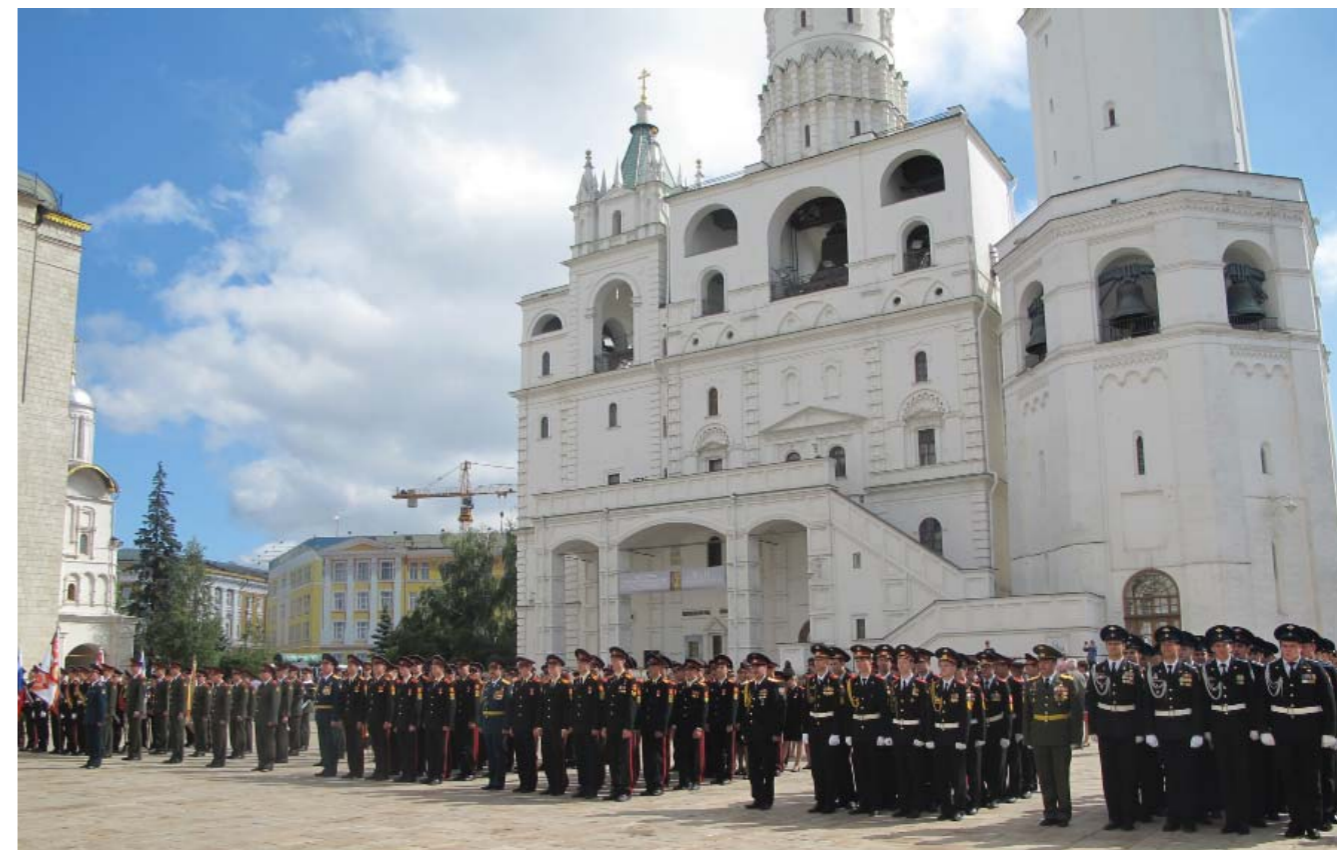
Торжественное построение выпускников Московского СВУ на Соборной площади Кремля

В целом. В СССР с момента образования национальной суворовской военной школы в 1943 году и до 1963 года, училища комплектовались детьми погибших офицеров и работников государственной службы, в течение семи-девяти лет им давалось широкое гуманитарное образование, государ-