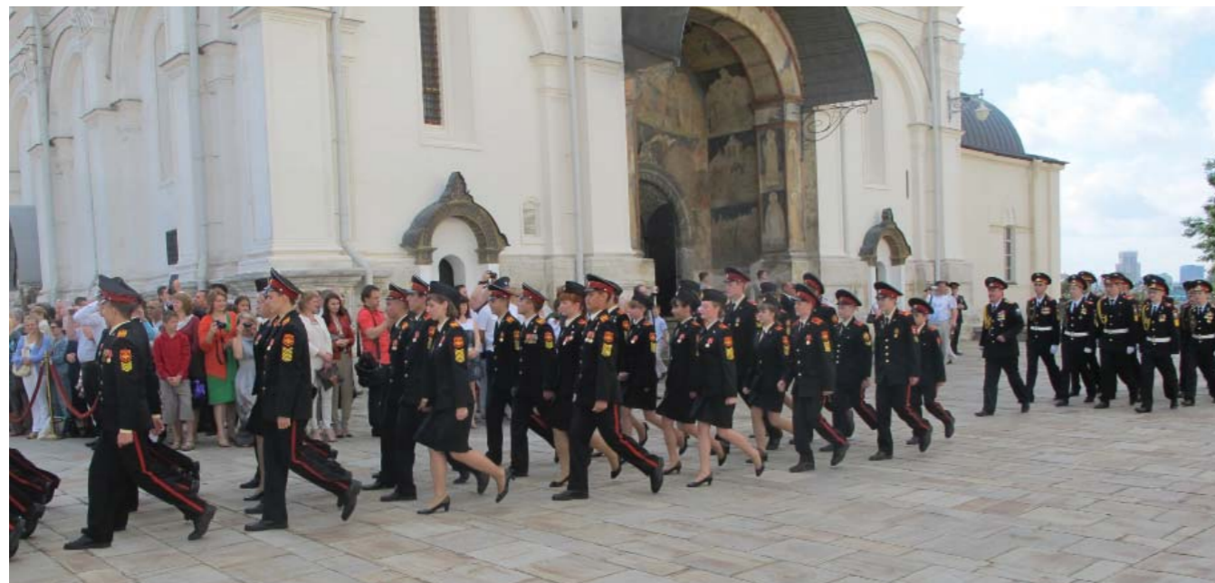
Выпускники Московского СВУ на Соборной площади Кремля

В эти корпуса могут поступать дети любых родителей и способностей, отбор в корпуса практически отсутству-