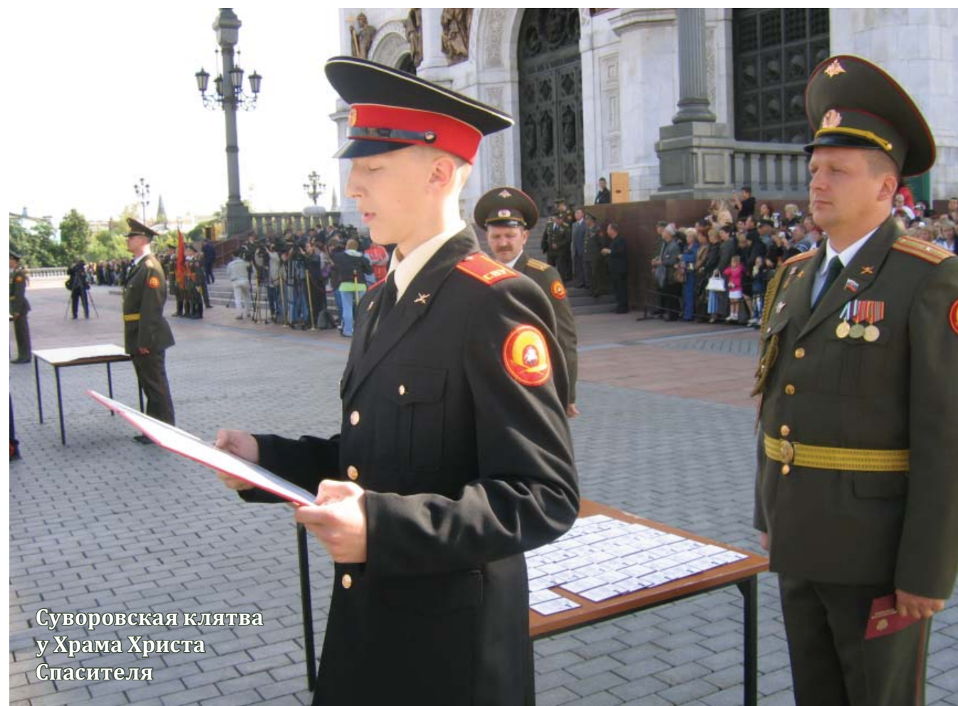
Суворовская клятва у Храма Христа Спасителя

Как показывает анализ, специфика предназначений учреждений кадетского образования, а значит и специфика образования получаемого их воспитан-