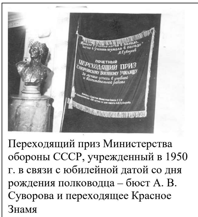
Переходящий приз Министерства обороны СССР, учрежденный в 1950 г. в связи с юбилейной датой со дня рождения полководца – бюст А. В. Суворова и переходящее Красное Знамя

Минское СВУ приняло первых своих воспитанников в 1953 году. Его