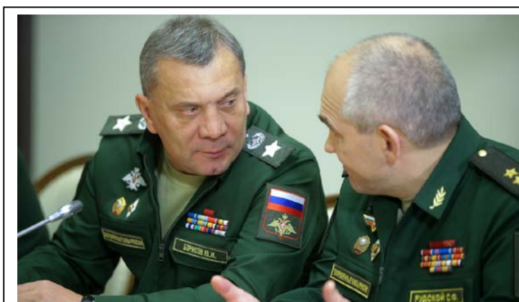
Заместитель министра обороны Ю. И. Борисов (Калининское СВУ) и начальник Главного оперативного управления Генерального штаба ВС РФ генерал-полковник С. Ф. Рудской (Минское СВУ)

Высоких служебных успехов достиг выпускник Калининского СВУ 1974 г. Ю.И. Борисов, заместитель Председателя Правительства Российской Федерации (с 18.05.2018 г.), а до этого назначения - заместитель министра обороны Российской Федерации (15.11.2012-18.05.2018 гг.), первый заместитель председателя Военно-промышленной комиссии при Правительстве Российской Федерации (3.03.2011-15.11.2012 гг.), заместитель министра промышленности и торговли Российской Федерации (2.07.2008-3.03.2011 гг.), действительный