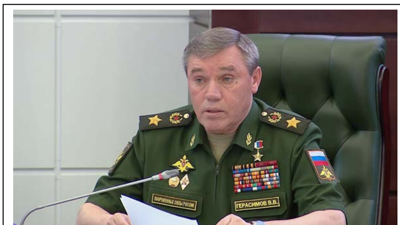
Начальник Генерального штаба Вооруженных Сил Российской Федерации, Герой Российской Федерации, генерал армии В. В. Герасимов (Казанское СВУ)

Многие из тех, кто окончил суворовские военные училища, продемонстрировали свои высокие профессиональные качества во многих сферах профессиональной деятельности. В своем приветствии по случаю 70-летнего юбилея суворовских военных и нахимовского военно-морского училища в г. Санкт-Петербурге министр обороны Российской Федерации генерал армии С.К. Шойгу отмечал: «За 70 лет своего существования система суворовских военных и нахимовских военно-морских училищ показала себя как эффективная школа образования и воспитания