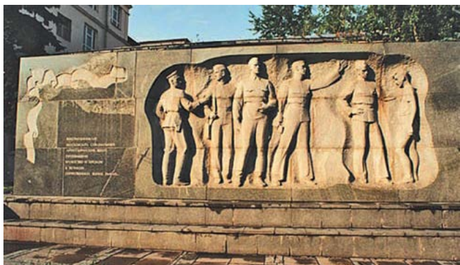
Памятник спецшкольникам в Москве

Совет ветеранов артиллерийских спецшкол и артиллерийских подготовительных училищ России Благотворительный фонд «КУТУЗОВ» Санкт-Петербургского Суворовского военного училища, Военно-исторический музей артиллерии, инженерных войск и войск связи