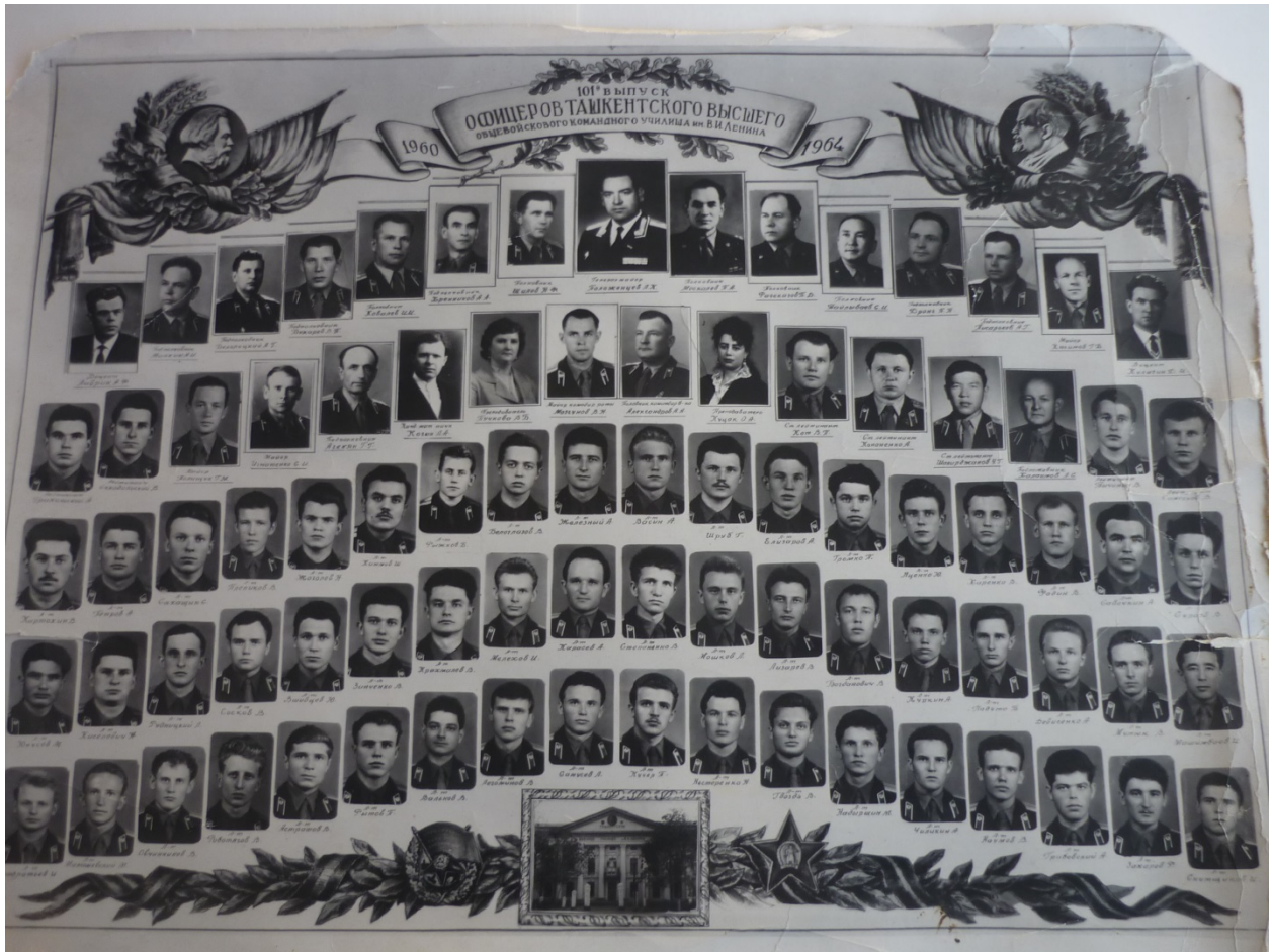
ТВОКУ, 1961-1964 г.