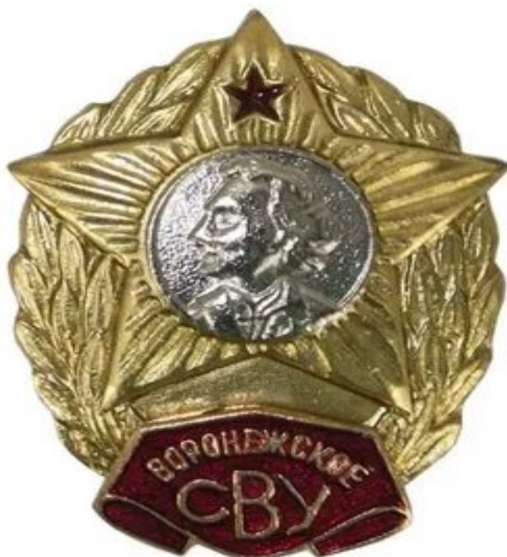
Суворовец Воронежского СВУ, 1953-1961годы