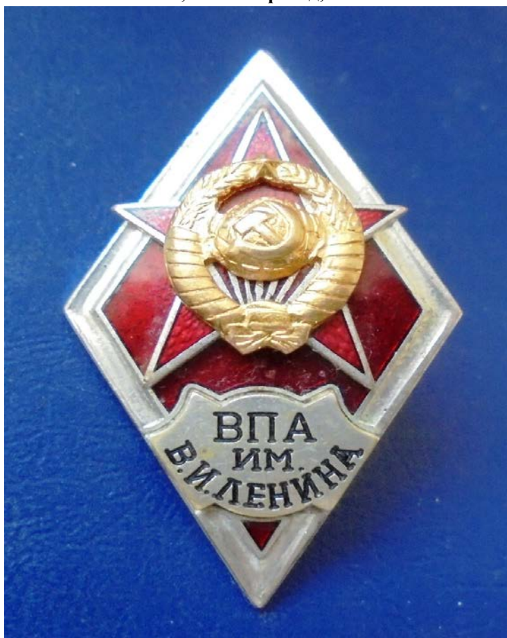
Военно-политическая академия им. В.И.Ленина, 1969-1973 г.