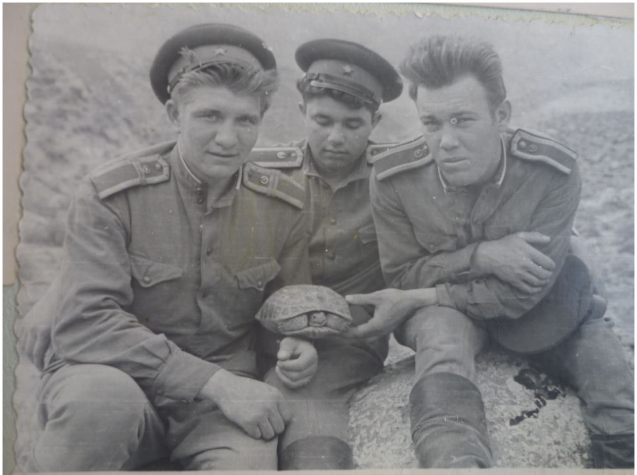
Курсант ТВОКУ, с друзьями