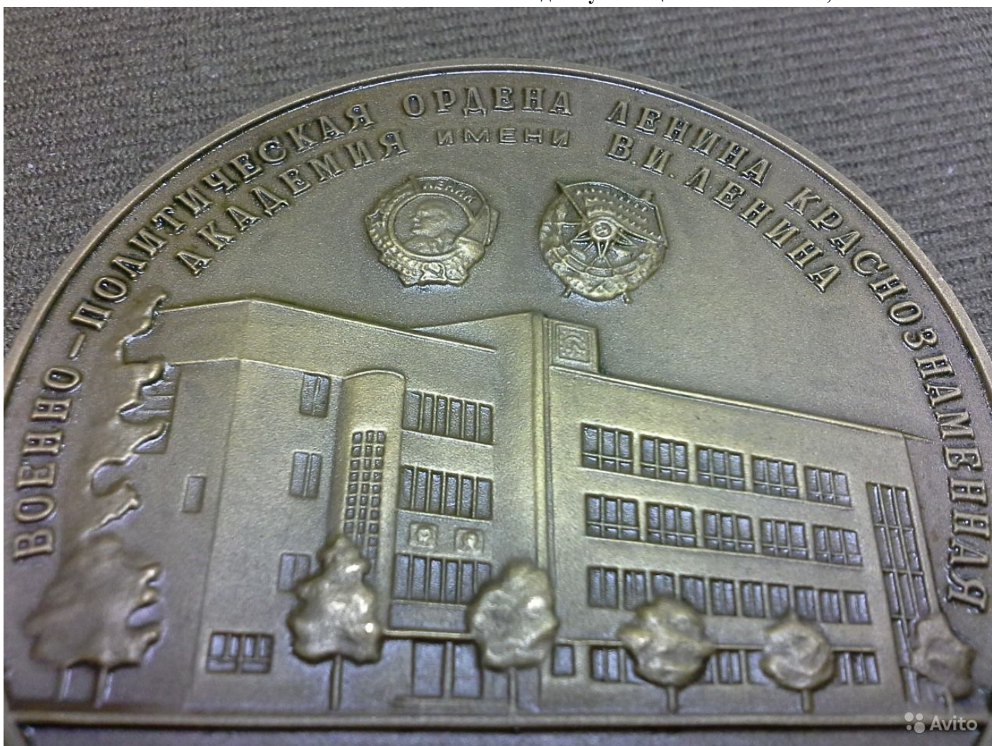
Адъюнктура при Военно-политической академии им. В.И.Ленина, 1975-1978 г.