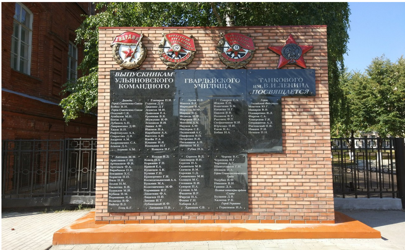
Ульяновское высшее танковое командное училище им. В.И.Ленина, 1973-1975 г.