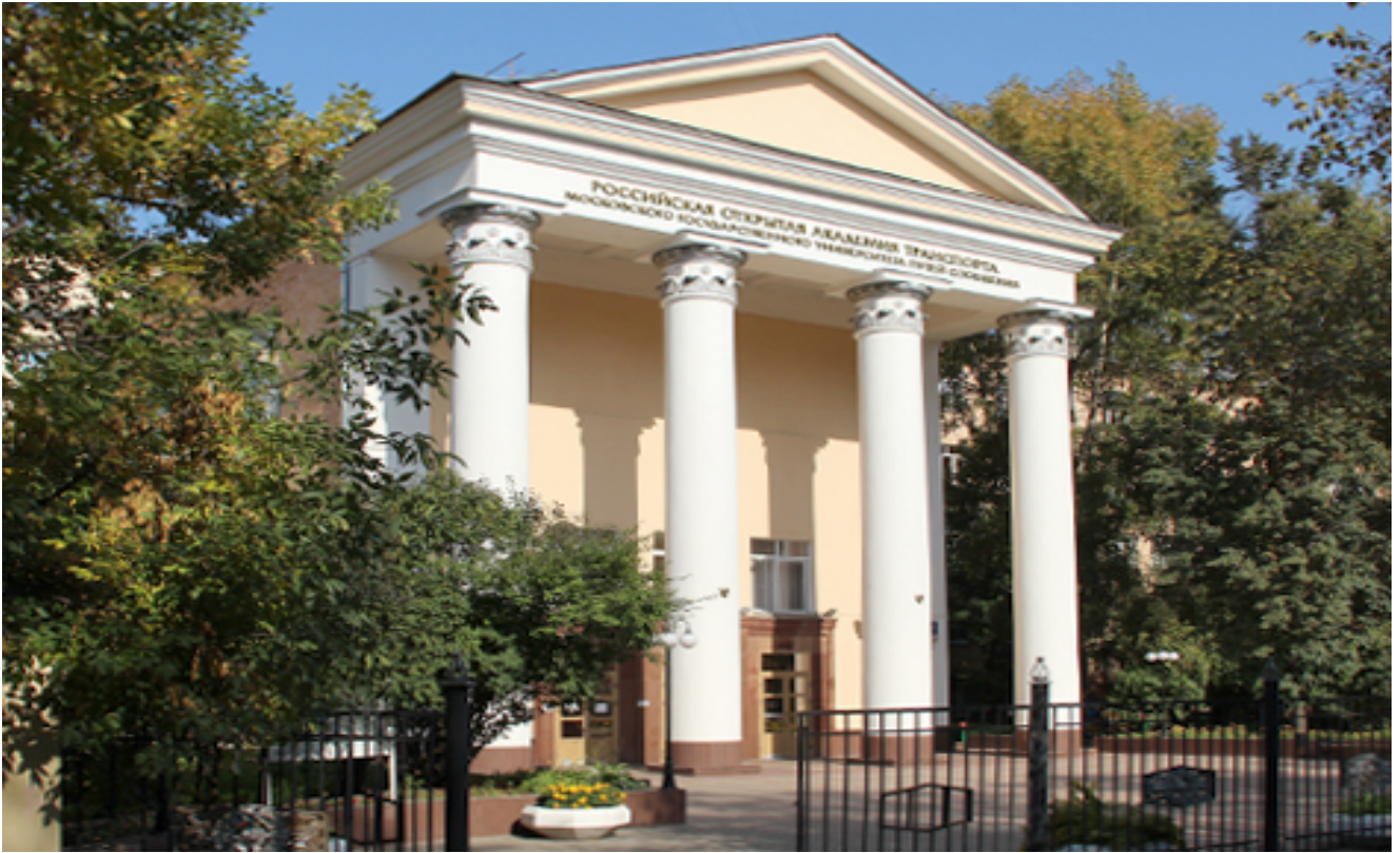
РОАТ МИИТ, 1993-2019 г.