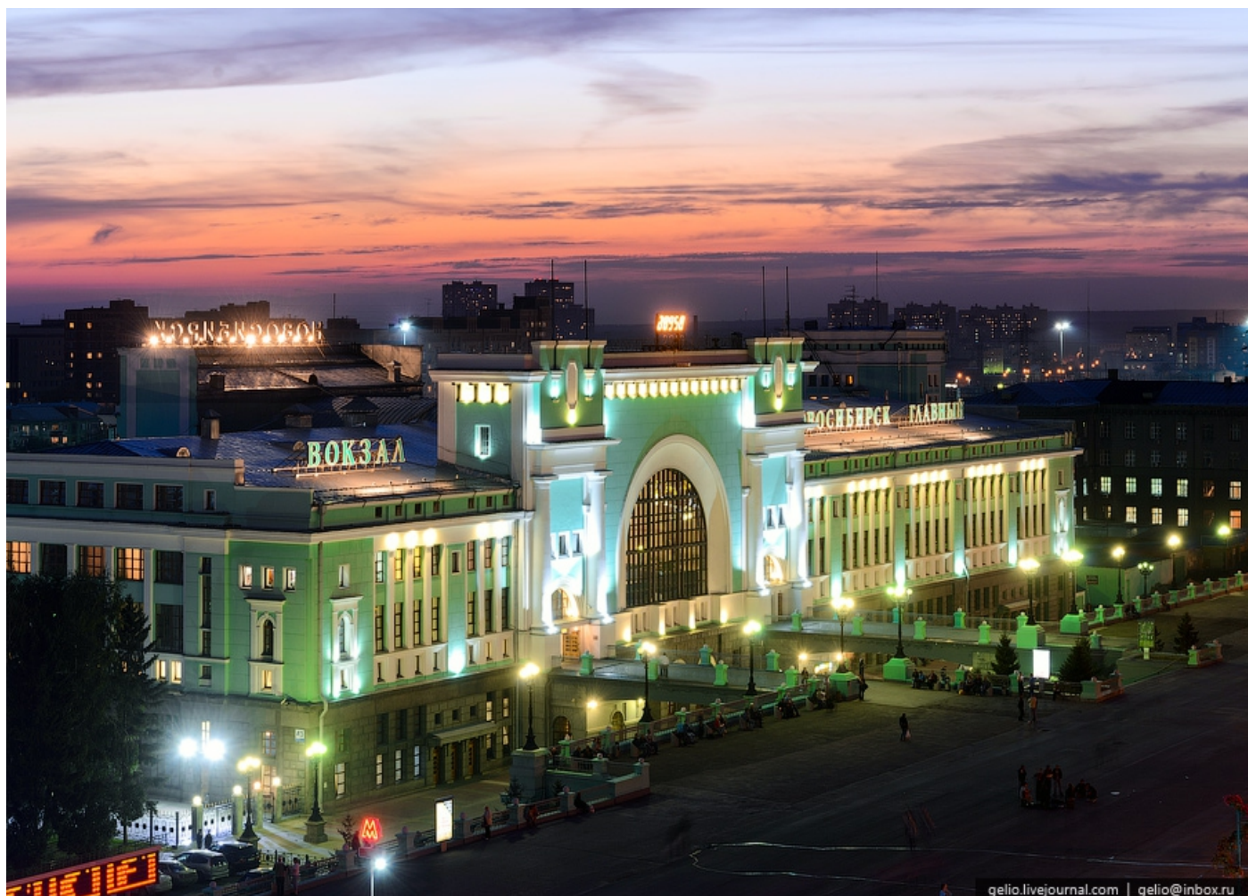
г. Новосибирск, железнодорожный вокзал