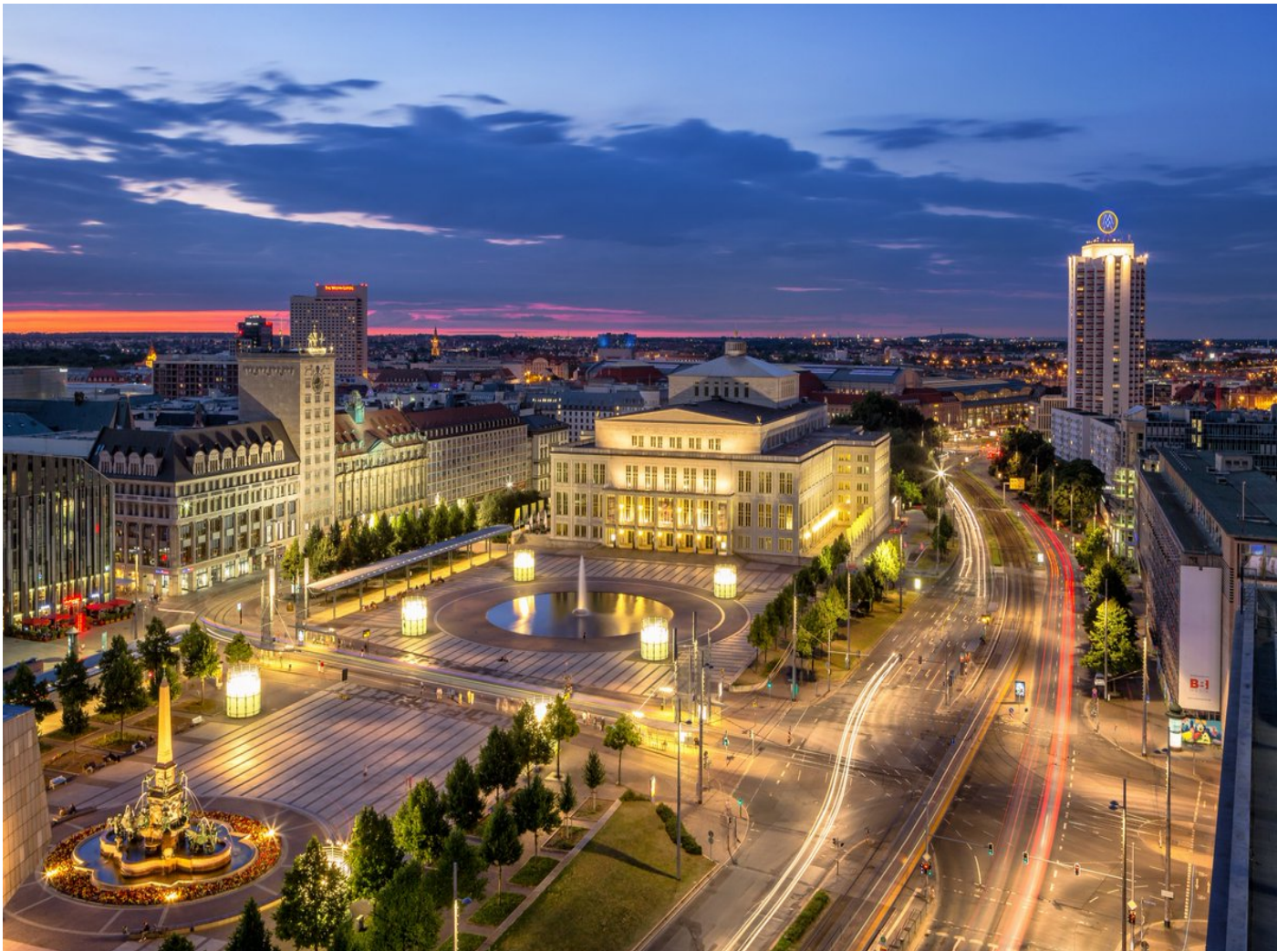
ГСВГ, г. Лейпциг, 1967-1969 г.