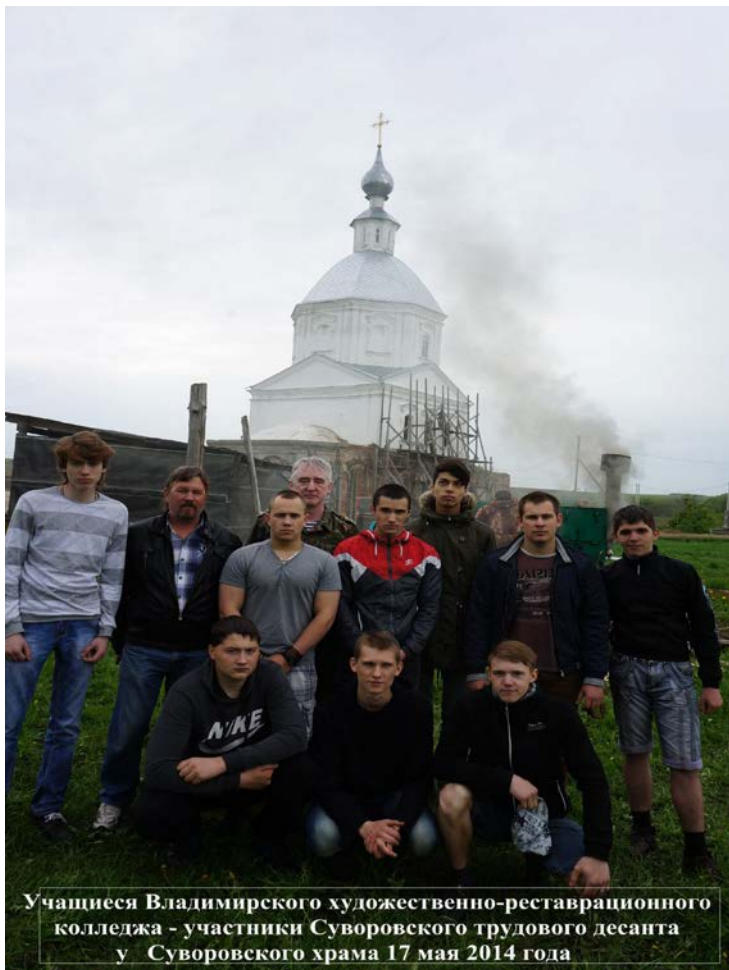
Учащиеся Владимирского художественно-реставрационного колледжа - участники Суворовского трудового десанта у Суворовского храма 17 мая 2014 года