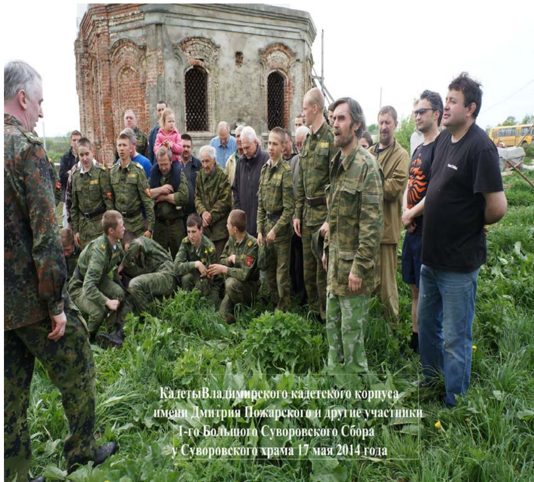
Кадеты Владимирского кадетского корпуса имени Дмитрия Пожарского и другие участники 1-го Большого Суворовского Сбора у Суворовского храма 17 мая 2014 года